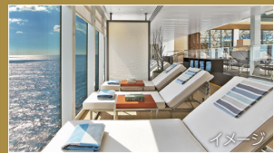
《 大海原を眺め 広々利用できる ラナイ 》