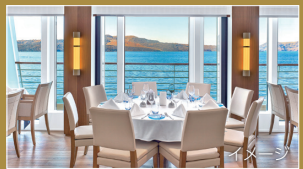
《 選べる 8つの レストラン&バー 》