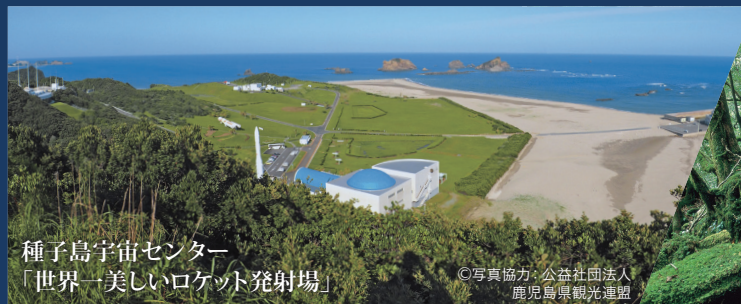
種子島宇宙センター 「世界一美しいロケット発射場」