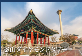
釜山ダイヤモンドタワー