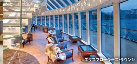
エクスプローラーズ・ラウンジ