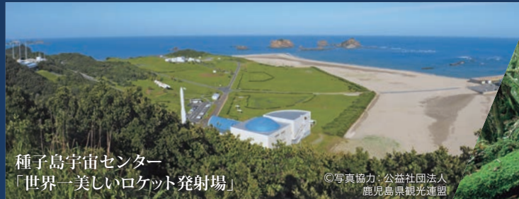
種子島宇宙センター 「世界一美しいロケット発射場」

北欧スタイルの船で航く 大人のための優雅な旅 秋彩る世界遺産と魅惑の都市をめぐる