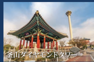
釜山ダイヤモンドタワー