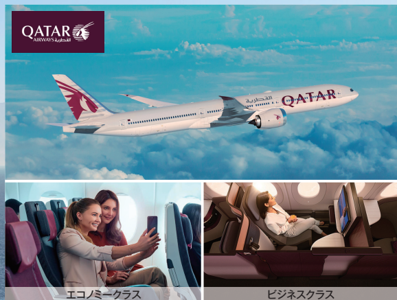
エコノミークラス