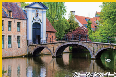
ブルージュ(ベルギー)