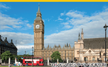
ロンドンのビッグベン(イギリス)