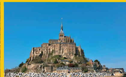
モンサンミッシェル(フランス) / オブショナルツアー