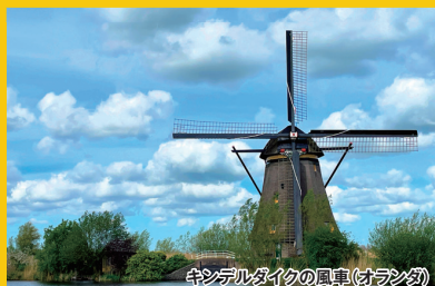
キンデルダイクの風車(オランダ)