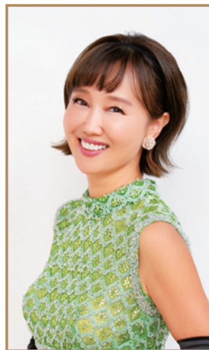
乗船区間:新宮~横浜 工藤夕貴 [女優・歌手]

28年ぶりの新曲、五木ひろし作曲の「父さん見えますか」、父・井沢八郎の「あゝ上野駅」、その他にもオールディーズからラテン、シャンソンまで幅広いナンバーで極上のステージをお届けいたします!