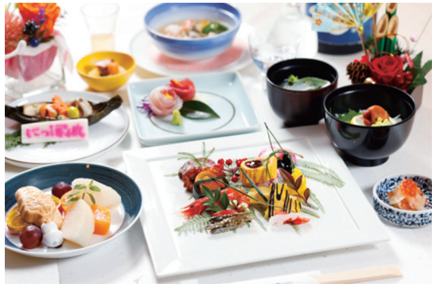
宝船御膳(イメージ)