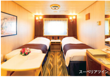
スーベリアツイン

スタンダードステート 1F 14㎡(丸窓) シャワートイレ付 コンフォートステート 3F 14㎡ シャワートイレ付 スーベリアツイン 2F 14㎡~18㎡ 3F・4F 14㎡ シャワートイレ付 4F 27㎡(車いす対応/バストイレ付) 4F 42㎡(コンセプトルーム6名様まで利用可)バストイレ付