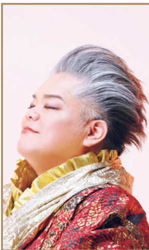
乗船区間:横浜~佐伯 岡本知高 [ソプラニスタ]

皆様お元気でお過ごしでしょうか。ソプラニスタの岡本知高です。この度「初春の宝船にっぽん丸クルーズ~スペシャルエンターテイメント~」のステージで皆様にお目にかかれまことを心から嬉しく思っております。2025年のお正月、慶賀のエネルギーに満ちあふれる私の渾身の寿ぎの歌声をお届け致します。とくとご堪能くださいませ。