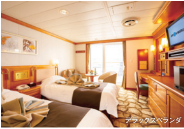
デラックスペランダ

デラックスツイン 5F 19㎡ バストイレ付 デラックスペランダ 5F 24㎡ バルコニー/バストイレ付 デラックスシングル 5F 13㎡ バストイレ付