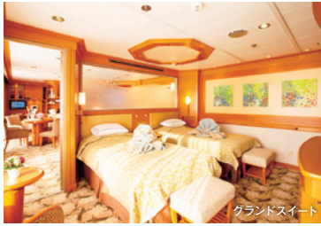
グランドスイート

ジュニアスイート 6F 31㎡ バルコニー/プロ/バストイレ付 オーシャンビュースイート 5F 33㎡ プロ/バストイレ付 ビスタスイート 6F 37㎡~46㎡ 5F 42㎡ バルコニー/プロ/バストイレ付 グランドスイート 6F 79㎡ バルコニー/プロ/バストイレ付