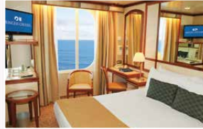
海側(約15㎡) シャワー付