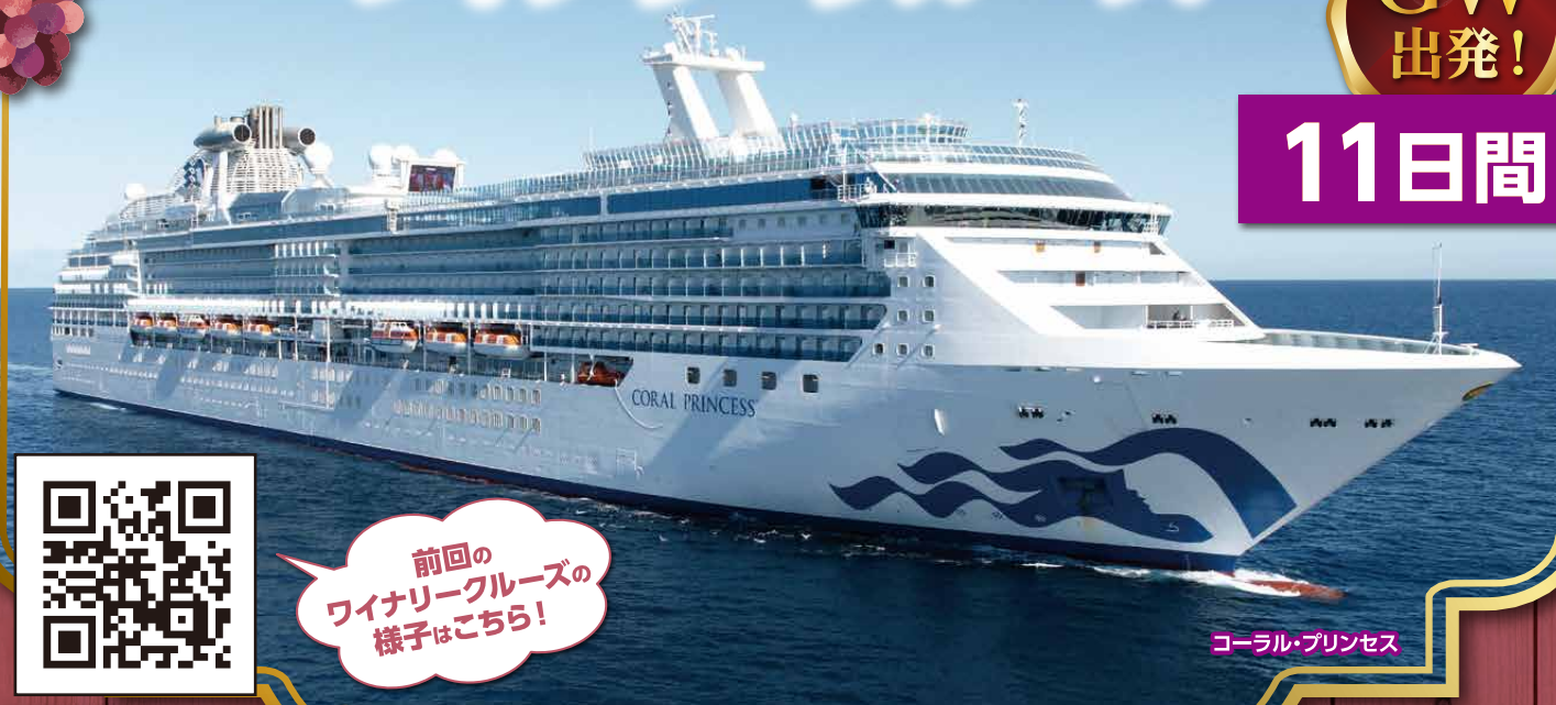
コーラル・プリンセス