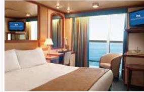
海側バルコニー(約20㎡) シャワー/バルコニー付