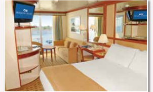
ジュニアスイート(約26㎡) バスタブ/バルコニー付