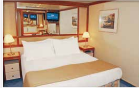
内側(約15㎡) シャワー付