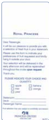
ブレックファストオーダー(イメージ) フルーツオーダー(イメージ)