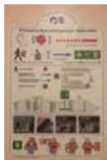
安全に関する注意(イメージ)

一般緊急警報は、乗船客の皆様を所定のマスターステーションに誘導するために使用されます。マスターステーションは緊急時に皆様にご集合いただく、安全な場所です。マスターステーションの場所は、客室ドアの近くにある「安全に関する注意」に記してあります。一般緊急警報は、船の警笛や警報音によるもので、7回あるいはそれ以上の短い警報に続いて長い警報が1回鳴ります。この警報が聞こえたら、船が航海中あるいは港に停泊中のいずれの場合でも、速やかにかつ落ち着いて客室に戻り、救命胴衣、暖かい服装、頭を覆うもの、歩きやすい靴、服用中の医薬品をまとめてお持ちになり、指定されたマスターステーションにお集まりください。移動の際には、停電になって閉じ込められる恐れがあるため、エレベーターはご使用にならないでください。マスターステーションに到着するまで、救命胴衣は着用しないでください。救命胴衣のストラップを床にひきずると、転倒など思わぬ事故の原因となりますので、お気をつけください。最寄りの非常口がふさがっている場合、客室ドア近くに掲示してある船内案内図に示されている別の非常口をご利用ください。マスターステーションに到着したら、スピーカーからの放送や場内にいる乗務員の指示がよく聞こえるように、静かに落ち着いてお待ちください。お身体が弱く、マスターステーションまでの移動にお手伝いを希望される方は、必要な手配を行いますので、早めに担当のルーム・стюワードあるいはゲストサービス・デスクまでお知らせください。