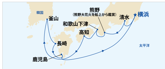
*熊野沖に停泊するため、下船することはできません。また花火の見え方は事前にご案内できません。特別割引キャンペーンは、総代金の20%の予約金(返金不可)が必要です。