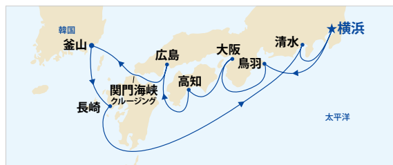
特別割引キャンペーンは、総代金の20%の予約金(返金不可)が必要です。