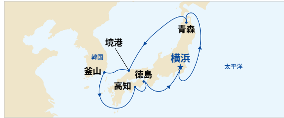
*青森ねぶた祭は、最終日の海上運行をご覧いただけます。特別割引キャンペーンは、総代金の20%の予約金(返金不可)が必要です。